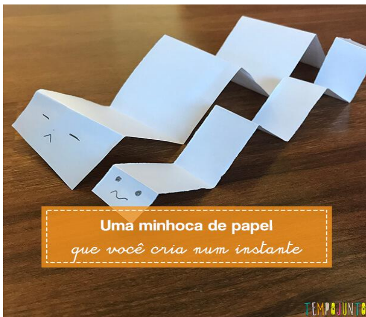
IMAGEM DA DOBRADURA

- VOCÊ ESTÁ COM SAUDADES DO CMEI? ENTÃO AGORA VOCÊ VAI FECHAR SEUS OLHOS, LEMBRAR DE COMO É O CMEI E FAZER UM DESENHO BEM LEGAL! CAPRICHE!!!!